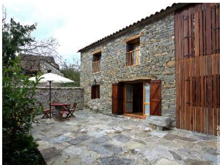
Instalações exteriores à disposição dos hóspedes