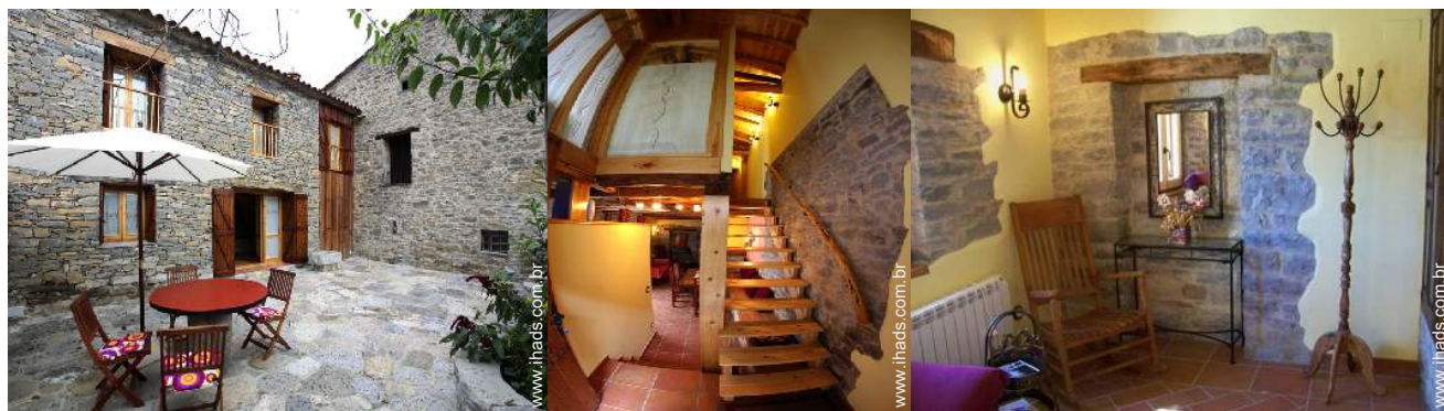
Instalações exteriores à disposição dos hóspedes