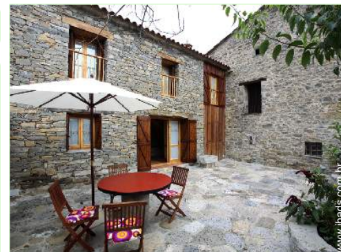
Instalações exteriores à disposição dos hóspedes