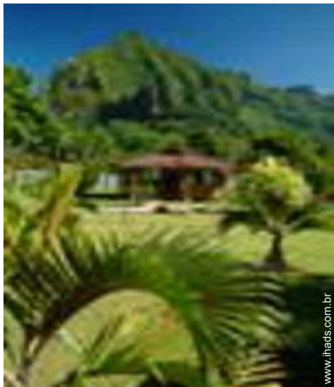
Bungalow de Luxo