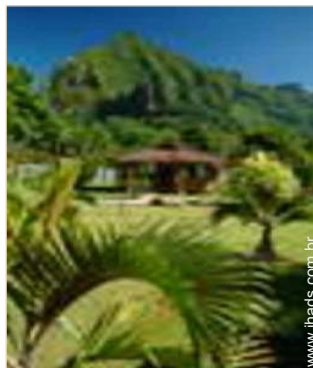
Bungalow de Luxo