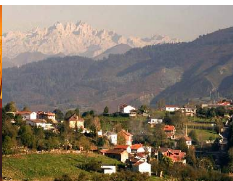
vista centro aldeia