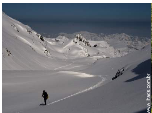
passeio de esqui