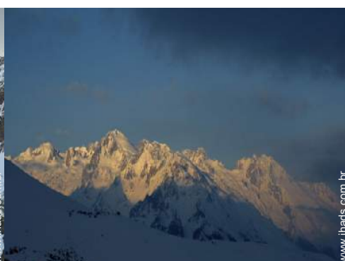
actividades de inverno nas proximidades