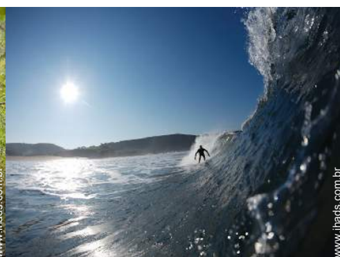
actividades náuticas nas proximidades