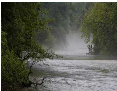
pesca à linha