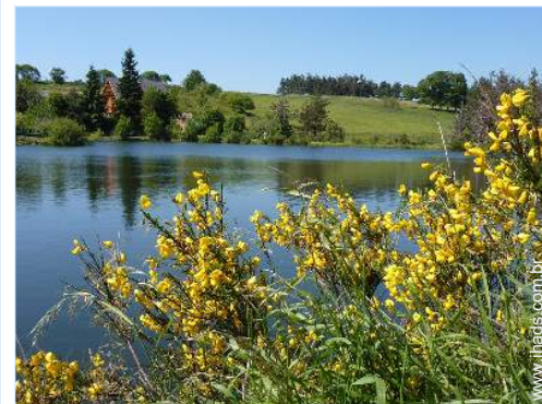
vista para lago

- Centro aldeia 2km - Padaria 2km - Pequenos comércios 2km - Supermercado 4km - Farmácia 2km