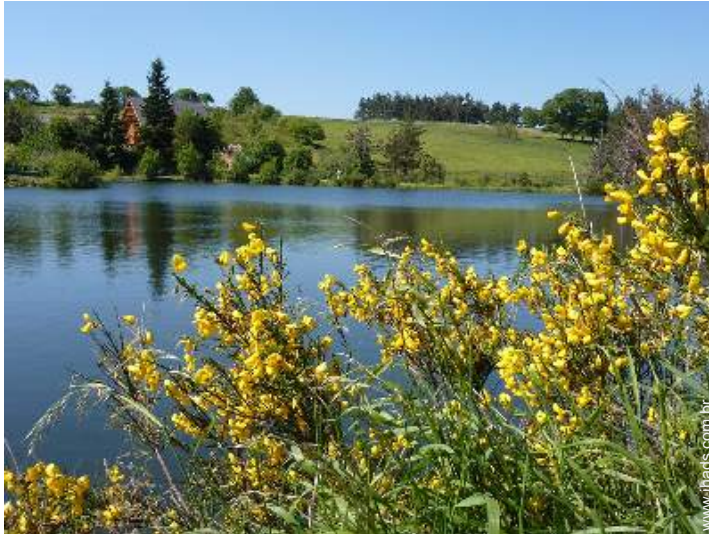
vista para lago