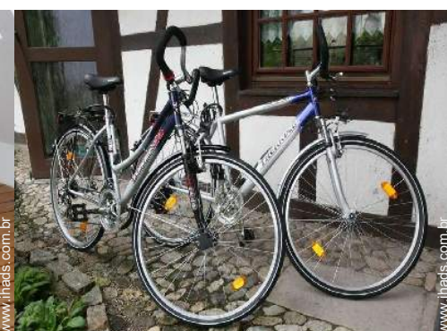
BTT (itinerário circuito)