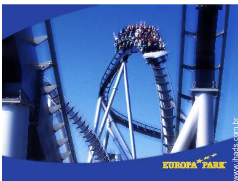
parque de lazer