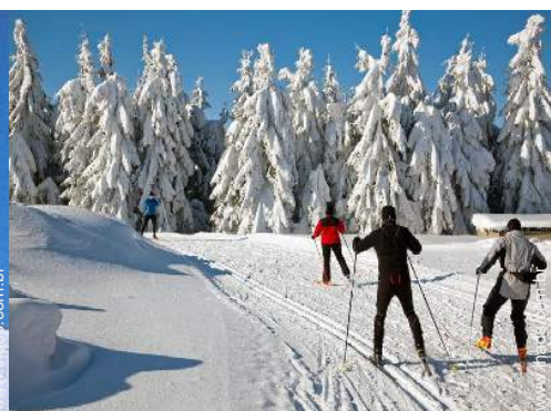
esqui de fundo