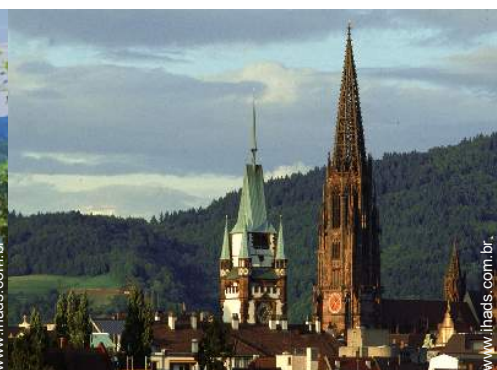
Cidades nas proximidades