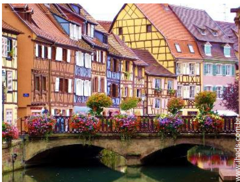
Cidades nas proximidades