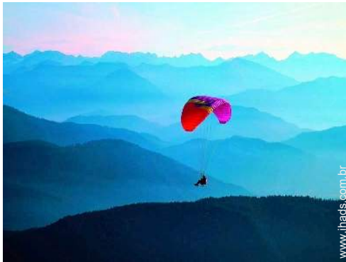
actividades aéreas nas proximidades