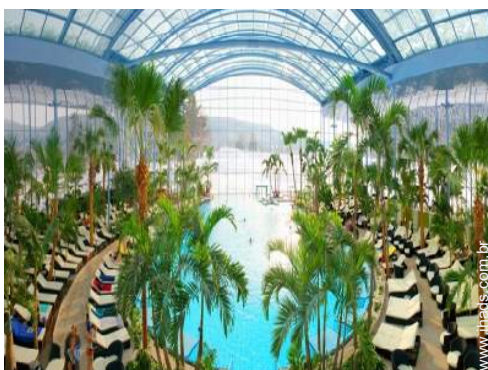
actividades balneares nas proximidades