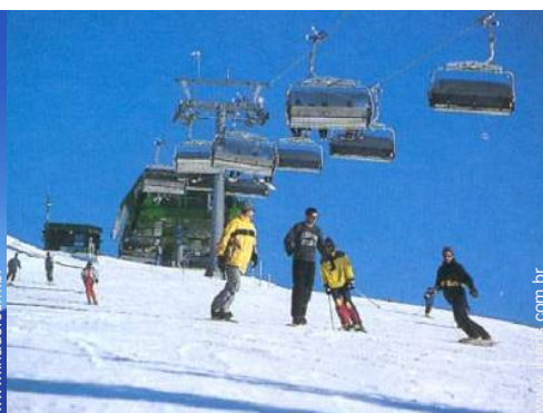
pistas de esqui