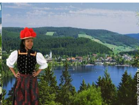
Cidades nas proximidades