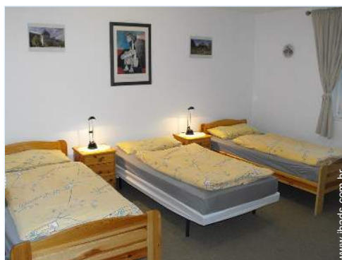
possibilidade de cama(s) extra(s)