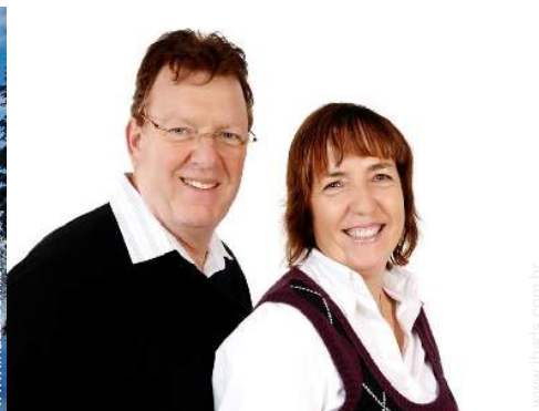
Os seus hóspedes