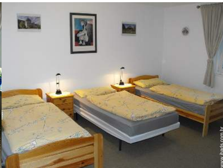
possibilidade de cama(s) extra(s)