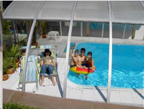
Piscina de água salgada