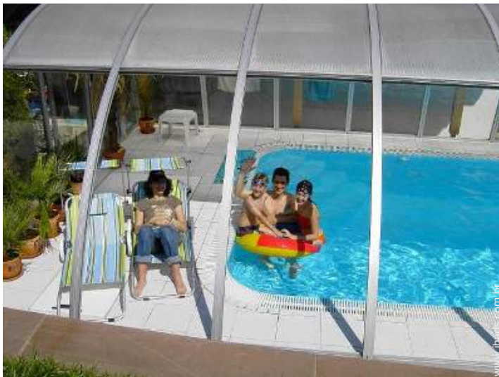
Piscina de água salgada