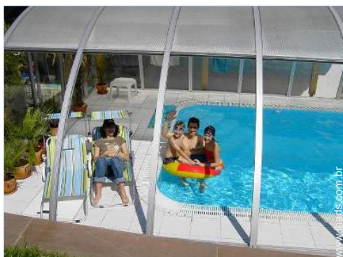
Piscina de água salgada