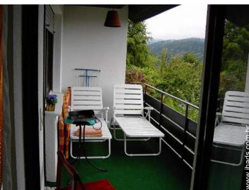
vista a partir da loggia