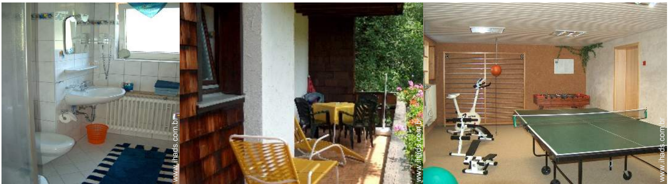
cadeira(s) de praia