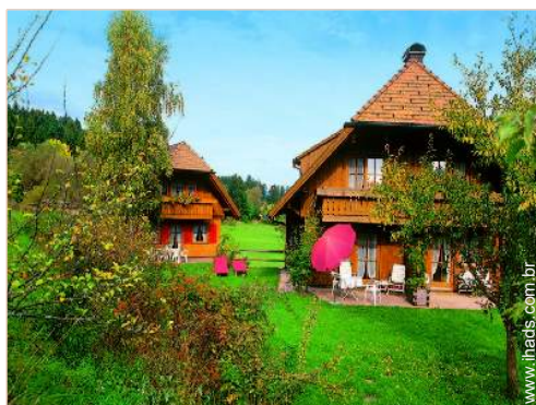
Propriedade de Encanto