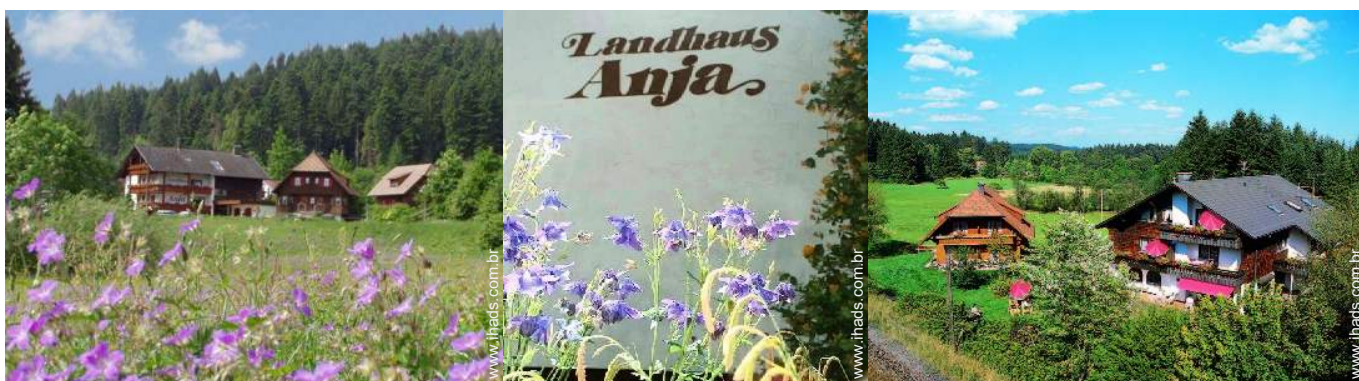
Propriedade de Encanto