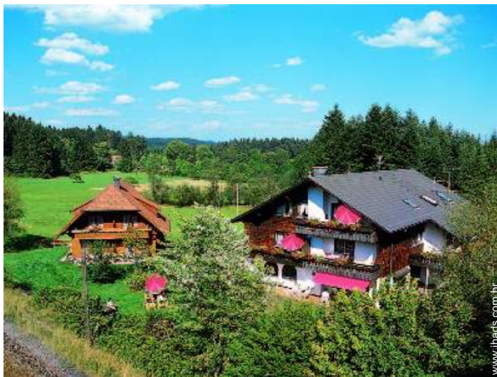
Propriedade de Encanto