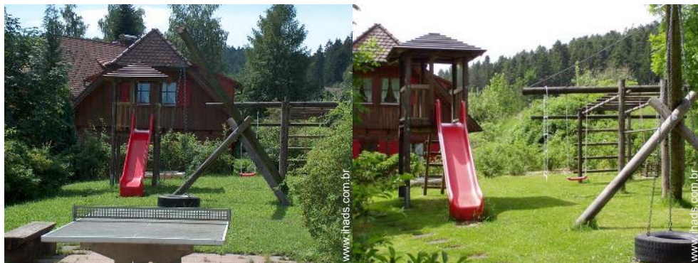
baloço para criança