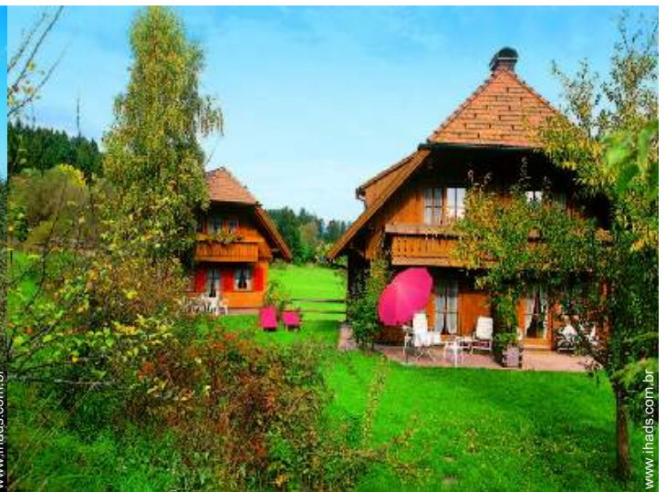
Propriedade de Encanto