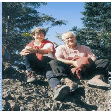
Os seus hóspedes