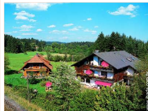
Propriedade de Encanto