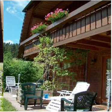
Propriedade de Encanto