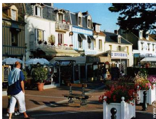
centro da cidade