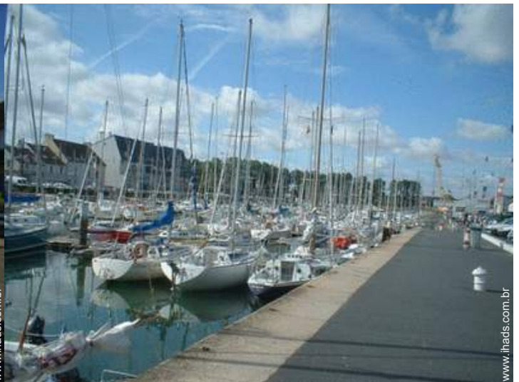
porto de recreio