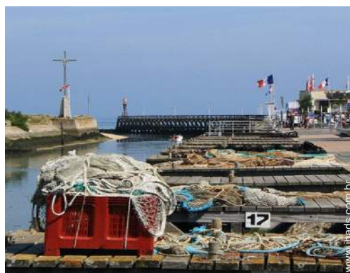
porto de recreio