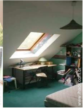
quarto do proprietário