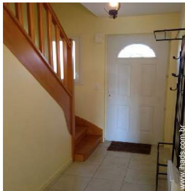
Conforto interior à disposição dos hóspedes