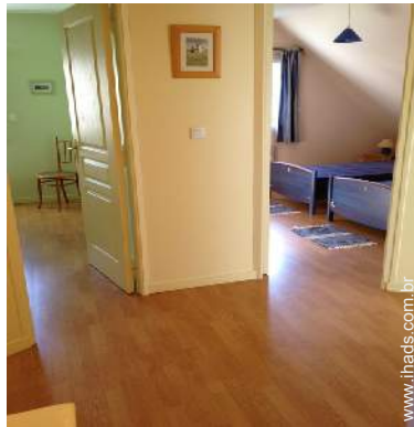
Conforto interior à disposição dos hóspedes