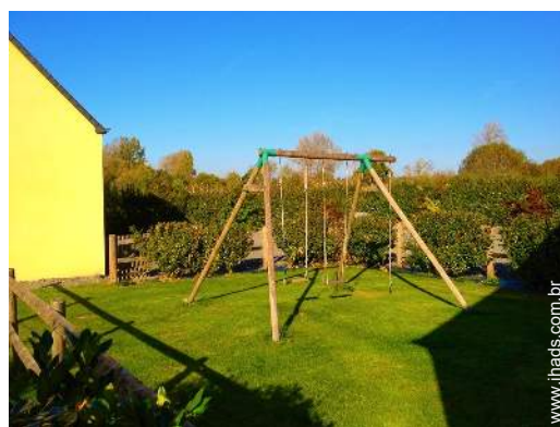
Equipamentos exteriores à disposição dos hóspedes