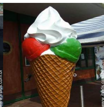
atividades de verão nas proximidades