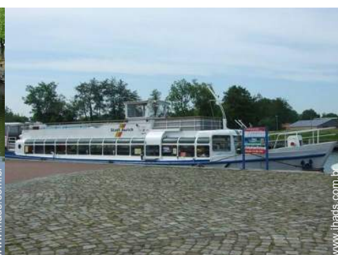
atividades de verão nas proximidades