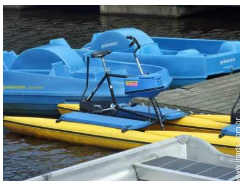
atividades náuticas nas proximidades