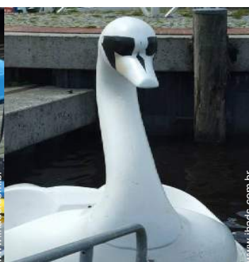
atividades nas proximidades