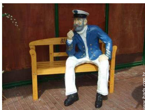
atividades nas proximidades