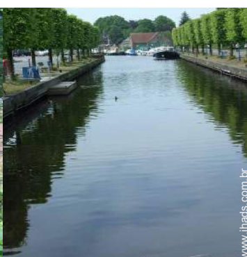
atividades de verão nas proximidades