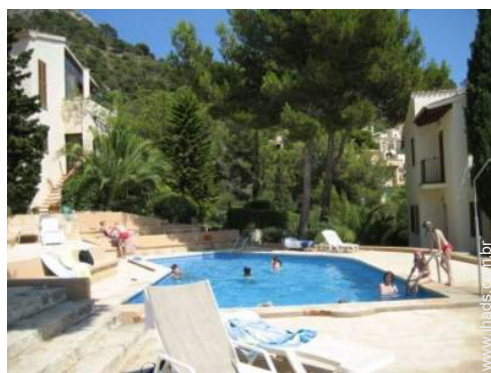
piscina na residência