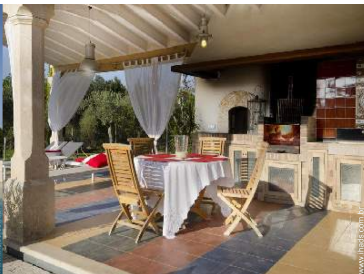
Propriedade de luxo