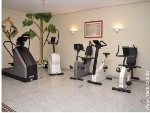
equipamento de musculação