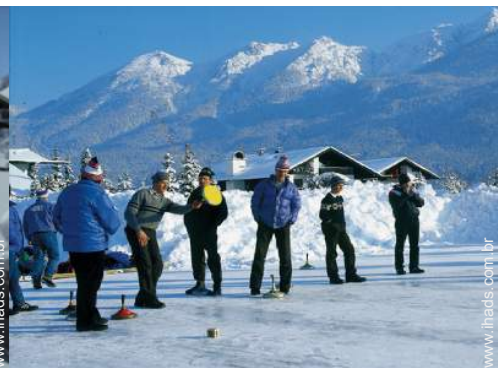
actividades de inverno nas proximidades