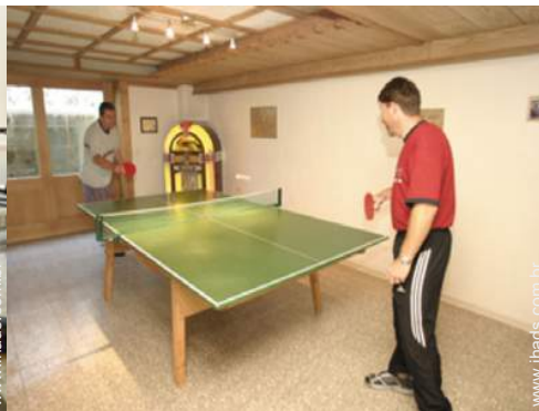
mesa de ping-pong