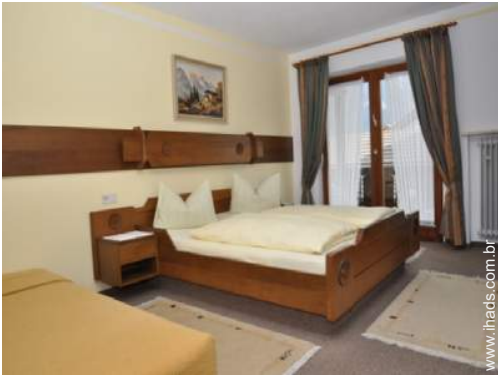
cama(s) de casal