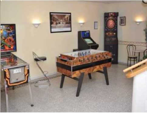
Equipamentos de lazer