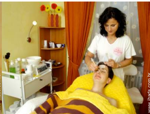
cuidados de beleza