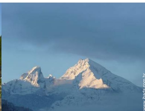
vista de serra