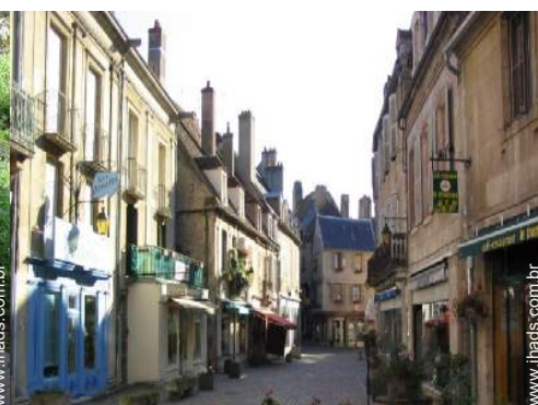
vista centro da cidade