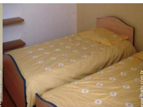
camas separadas simples