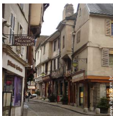
centro da cidade