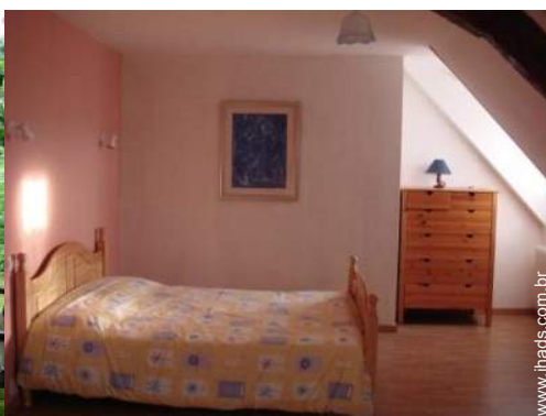
cama(s) de casal