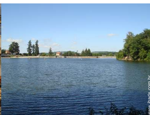
atividades de verão nas proximidades