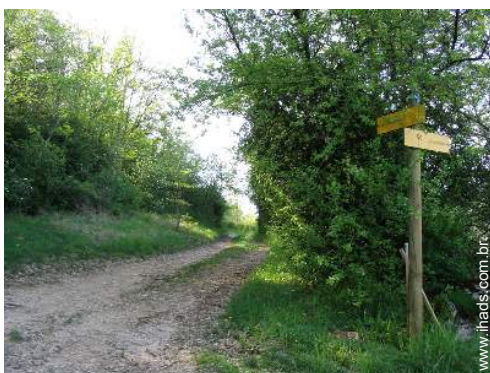
caminho de passeio