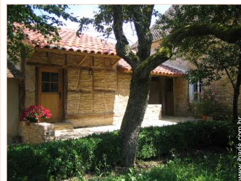
Casa de Encanto