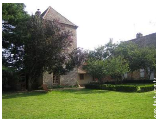
Casa de Encanto