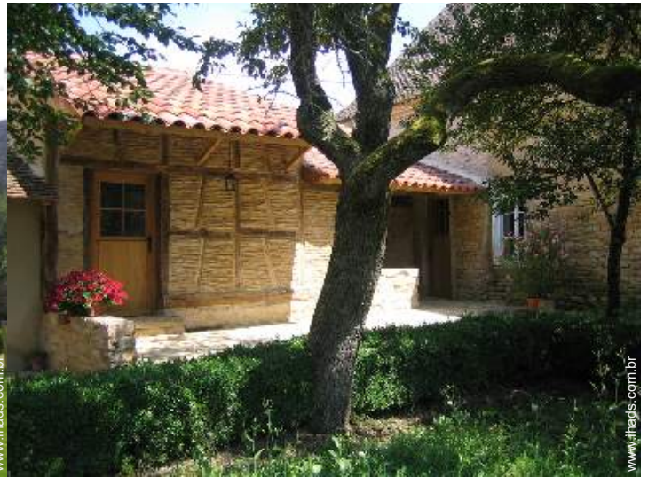
Casa de Encanto