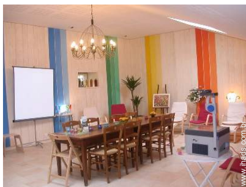
Conforto interior e equipamentos