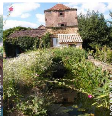
lago de jardim