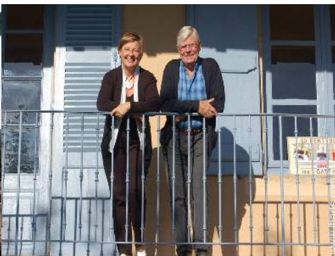
Os seus hóspedes