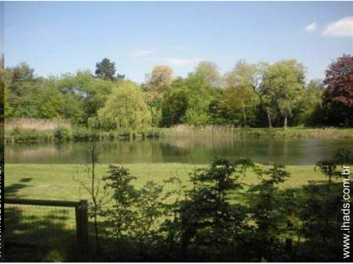
vista para lago