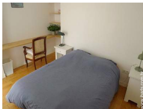
cama(s) de casal