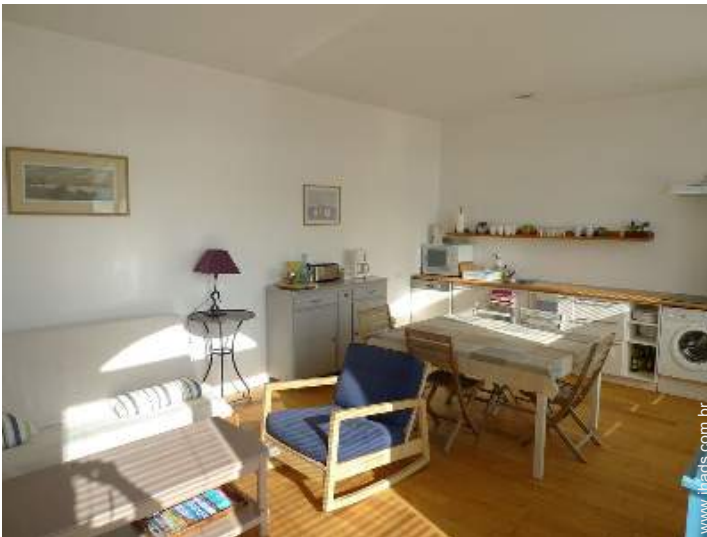
Divisões e comodidades