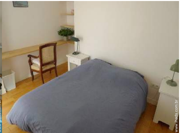
cama(s) de casal