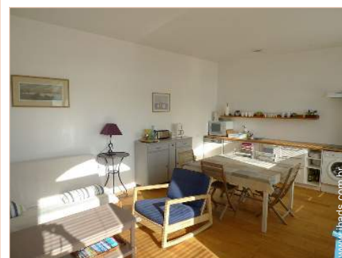
Divisões e comodidades