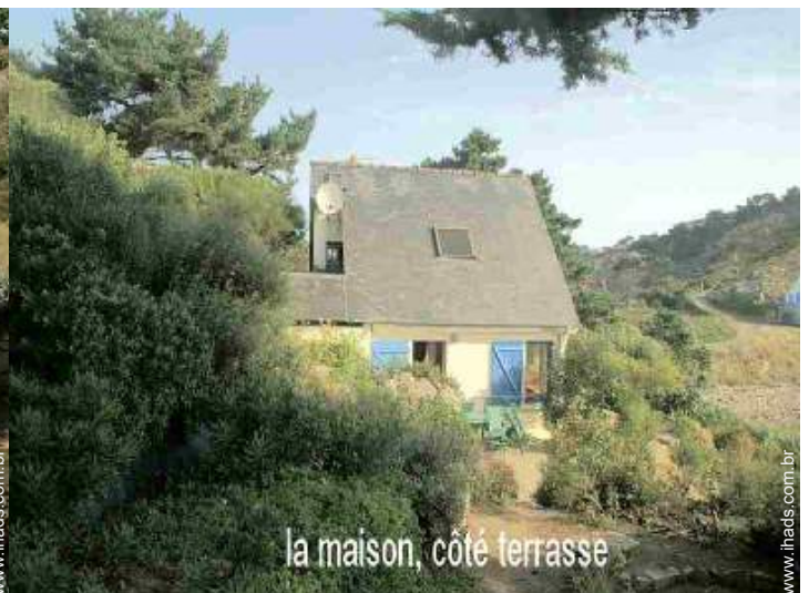
la maison, côté terrasse