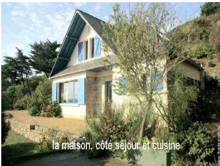
la maison, côté séjour et cuisine