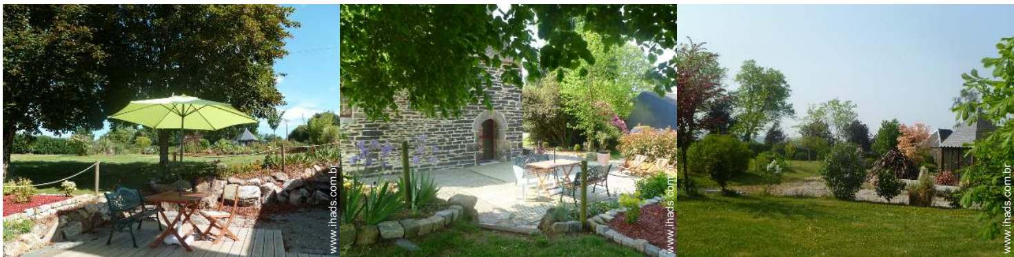
salão de jardim