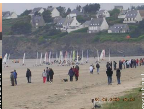
actividades nas proximidades