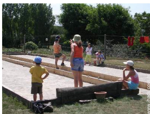
jogos de petanca