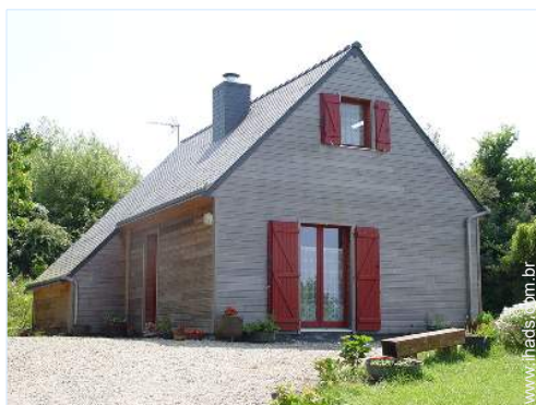
Casa em madeira