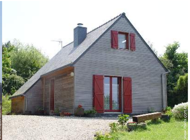
Casa em madeira