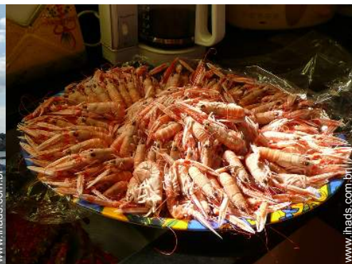
Atrações e lazer