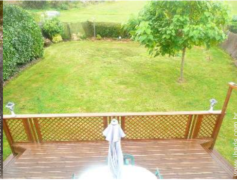
vista a partir da mezzanine