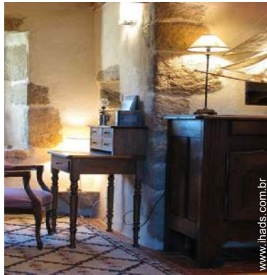
salão de música