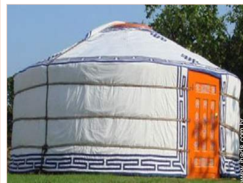
Ger de Encanto (tenda mongol)