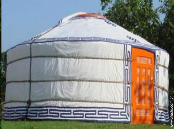
Ger de Encanto (tenda mongol)