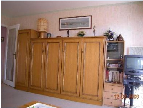
cama(s) convertível/eis dupla(s)