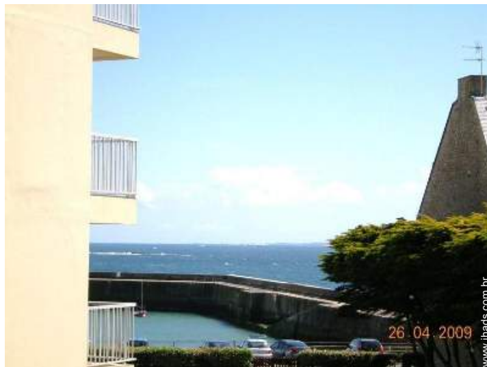
vista de mar