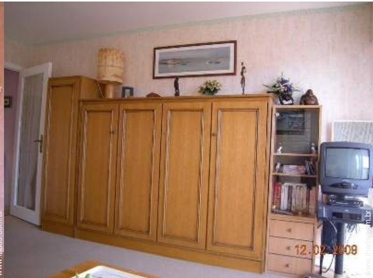
cama(s) convertível/eis dupla(s)