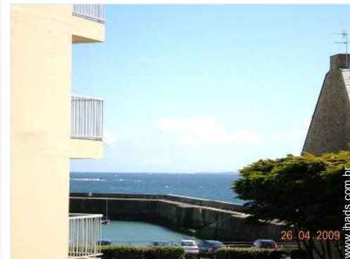
vista de mar