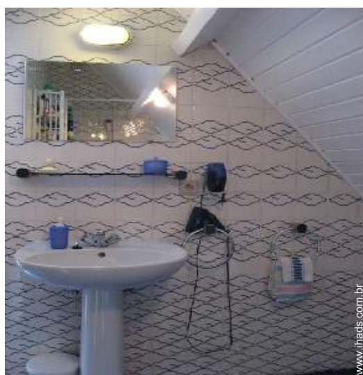
Divisões interiores à disposição dos hóspedes