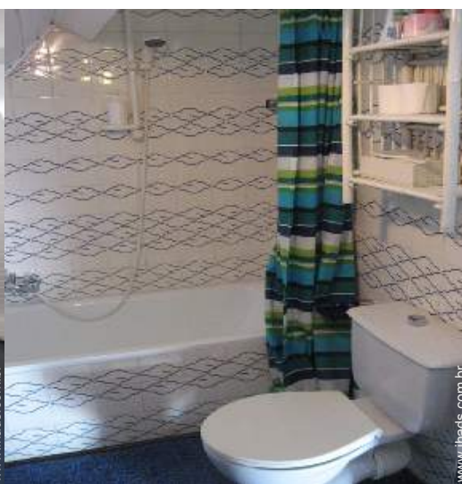
Divisões interiores à disposição dos hóspedes