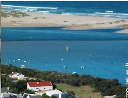
prancha à vela