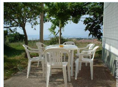
mesa(s) de jardim