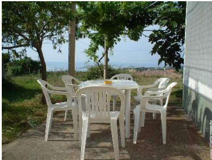
mesa(s) de jardim