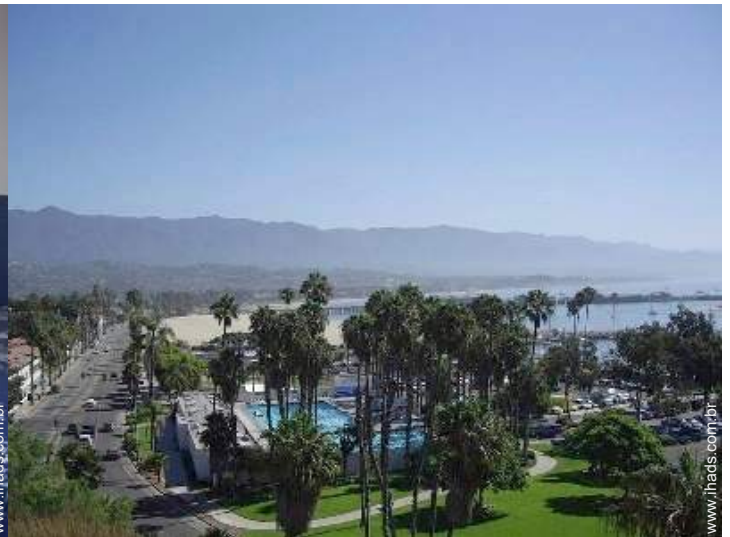
atividades balneares nas proximidades