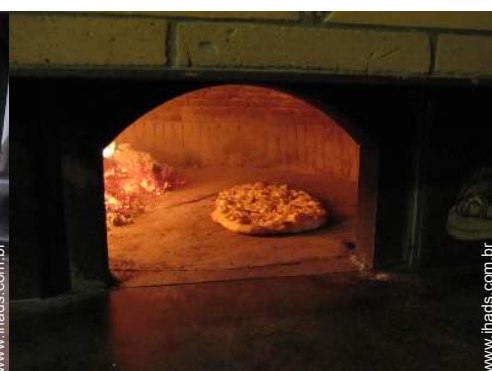
preparação refeição local