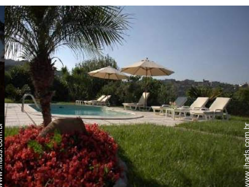
cadeira(s) de praia