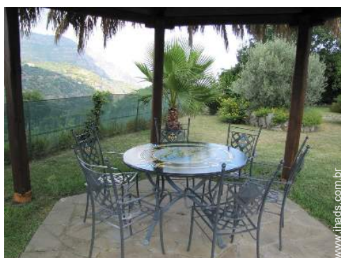
mesa(s) de jardim