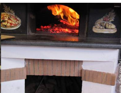
forno para pizza