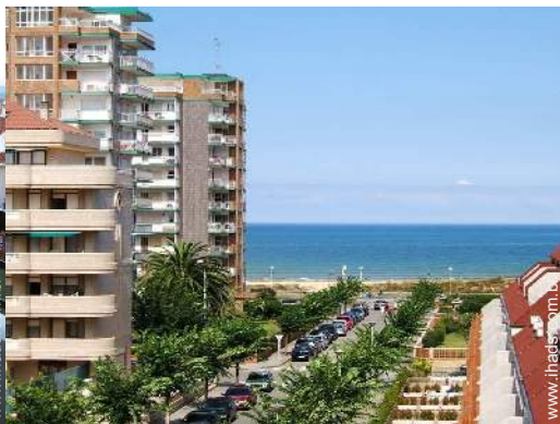
vista a partir do varandim