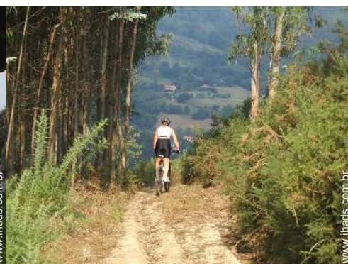
BTT (itinerário circuito)