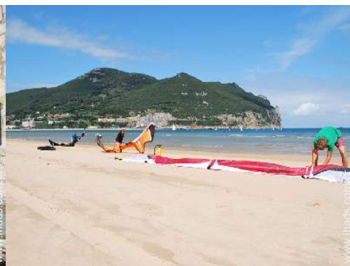
vista de mar