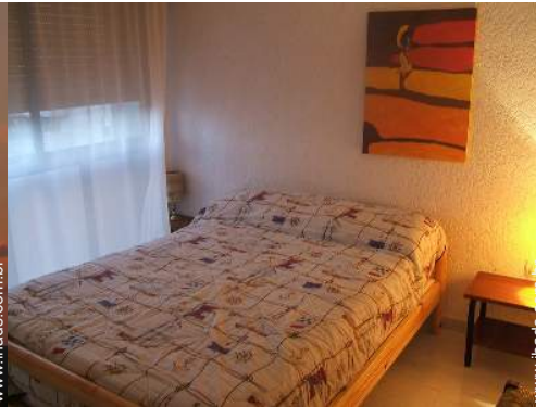
cama(s) de casal