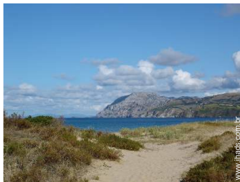
vista sobre o mar