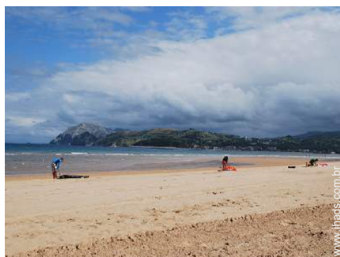
vista de mar