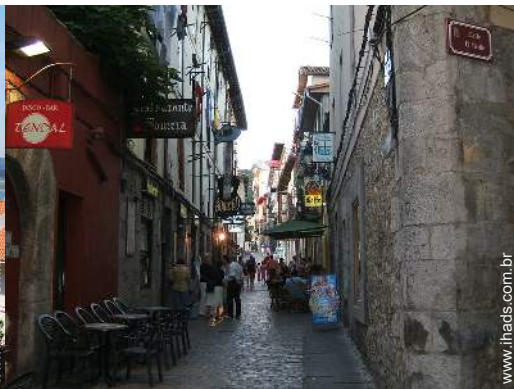
centro da cidade