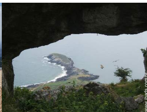
actividades de montanha nas proximidades