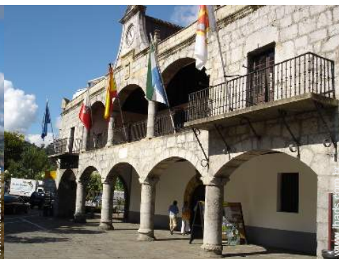
centro da cidade