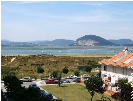
vista a partir do varandim