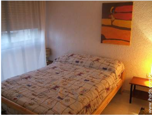
cama(s) de casal