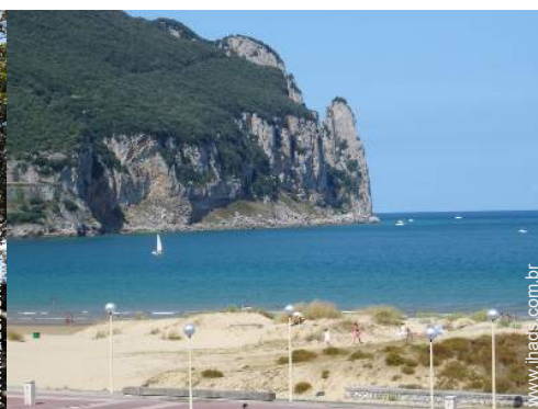
Atracções e lazer