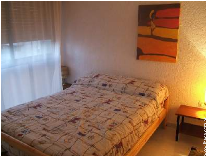
cama(s) de casal