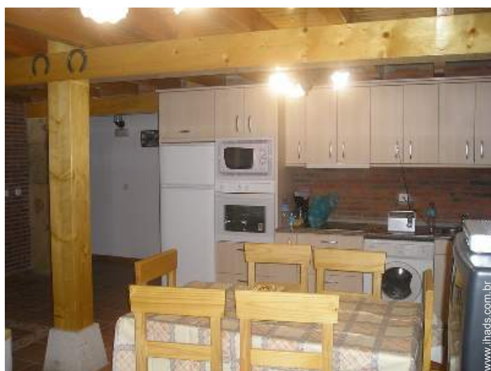
vista a partir da sala de jantar