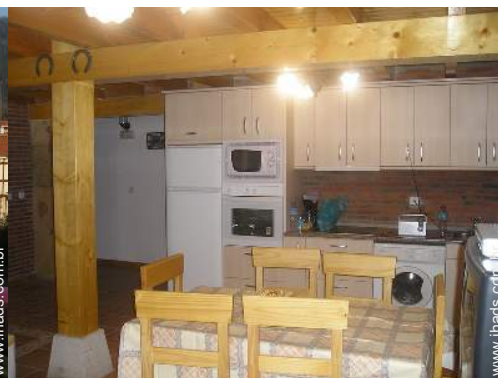
vista a partir da sala de jantar