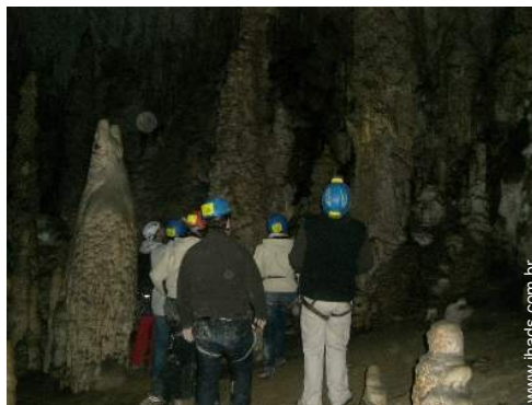
escalada em rocha