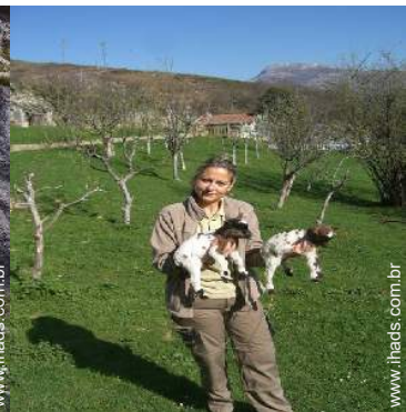
animais da quinta