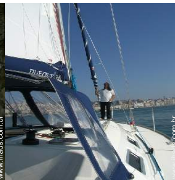
excursão de barco