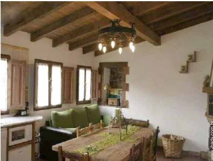
vista a partir da cozinha