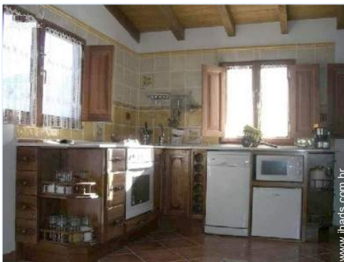
vista a partir do salão