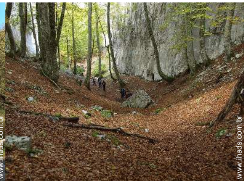
caminho de passeio