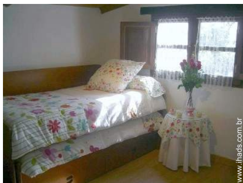
camas separadas simples