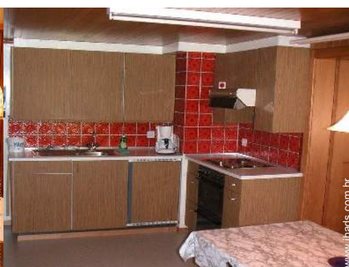
grande cozinha independente