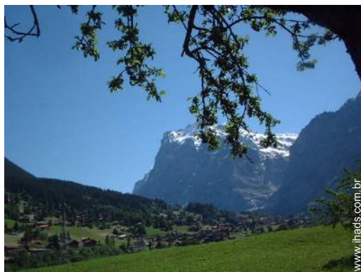
vista a partir da varanda