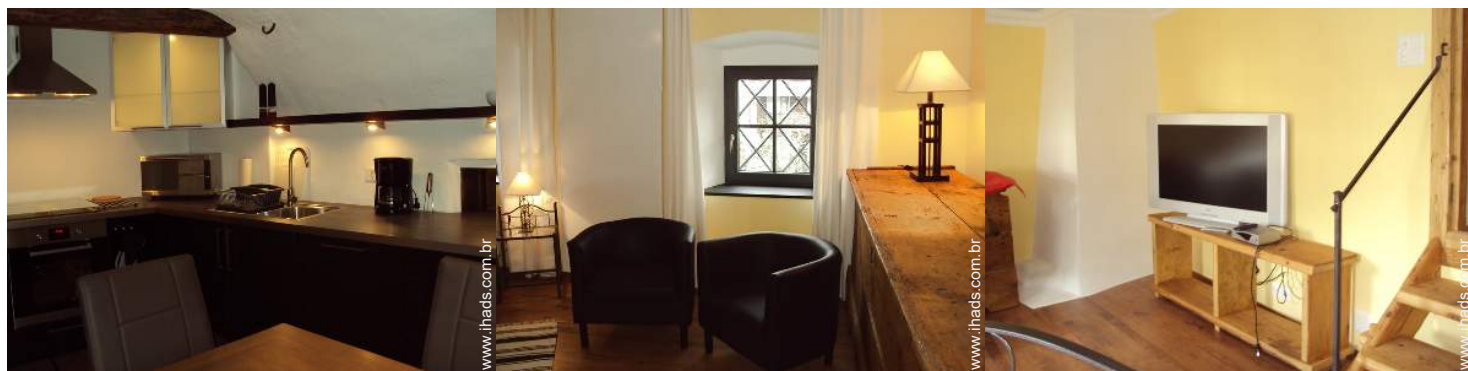
grande cozinha independente