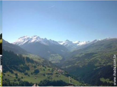
vista de serra