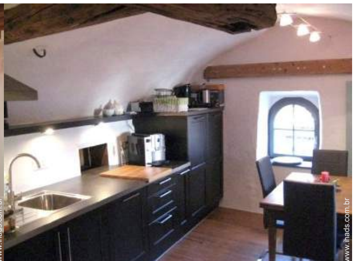
grande cozinha independente