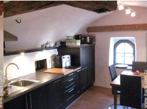
grande cozinha independente