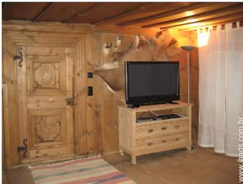
Divisões e comodidades