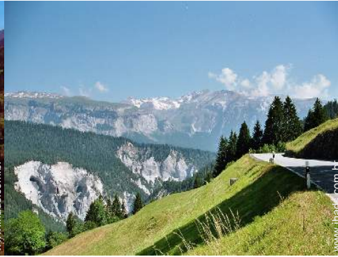
Atrações e lazer