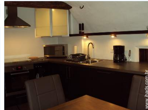
grande cozinha independente