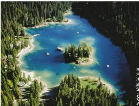
actividades balneares nas proximidades