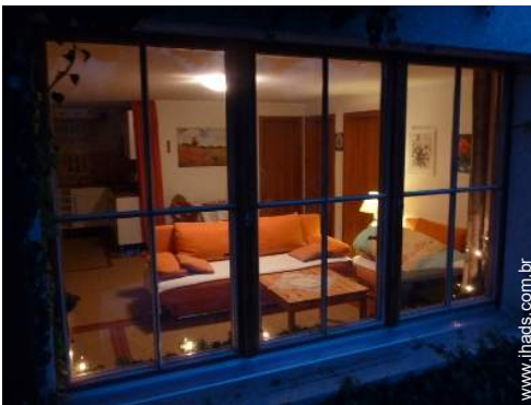
Conforto interior e equipamentos