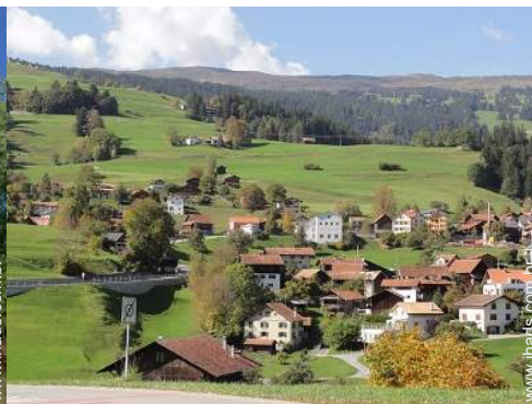
vista de campo