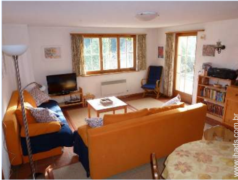
Conforto interior e equipamentos