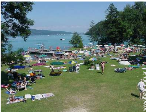
actividades balneares nas proximidades