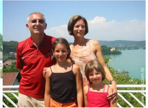
Os seus hóspedes