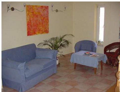
colecção de livros