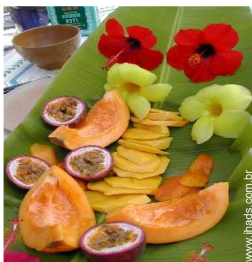
Presença no local