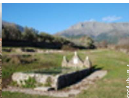
caminho de passeio