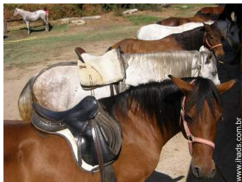
passeio a cavalo