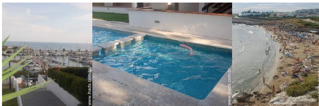
vista de porto