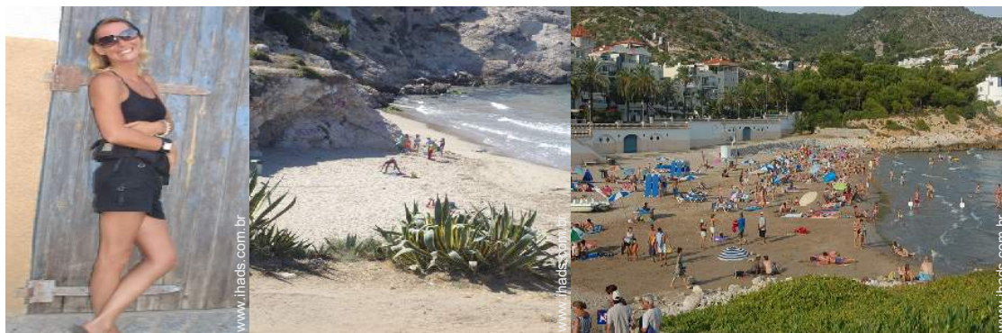
O seu hóspede