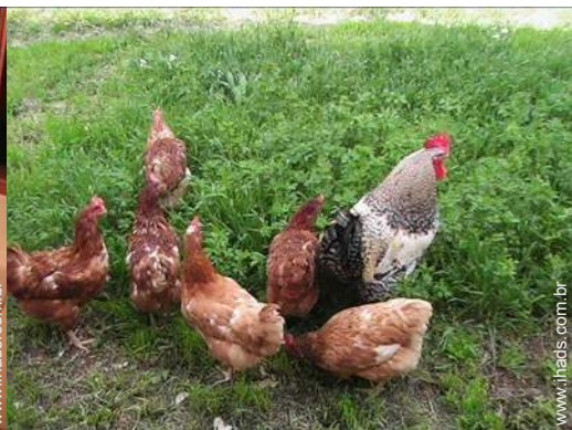
Os animais da casa