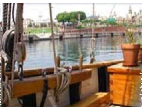
vista sobre o mar