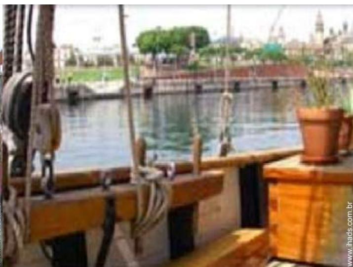
vista sobre o mar