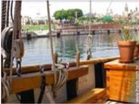
vista sobre o mar