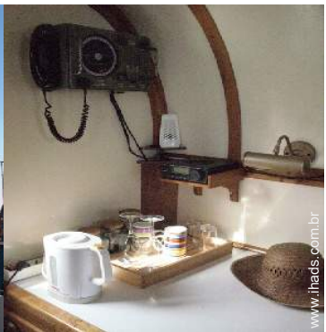
Conforto interior à disposição dos hóspedes