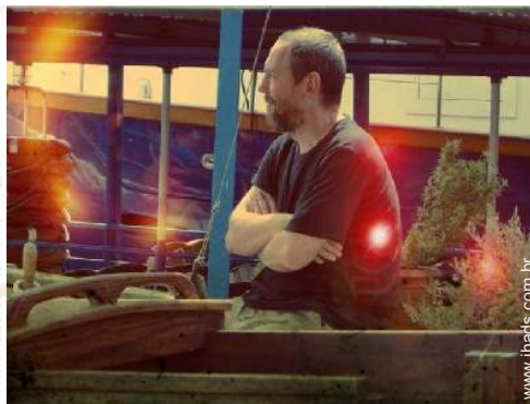
O seu hóspede