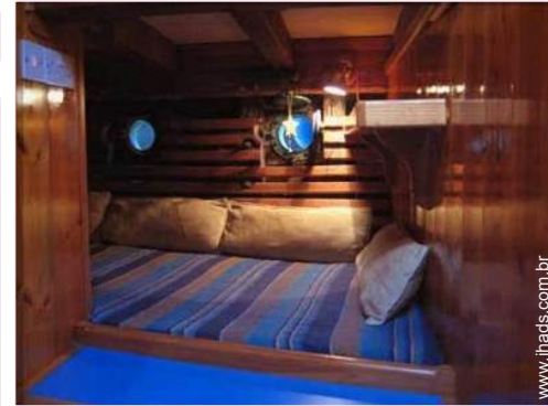
O quarto de hóspede