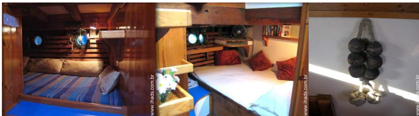
O quarto de hóspede