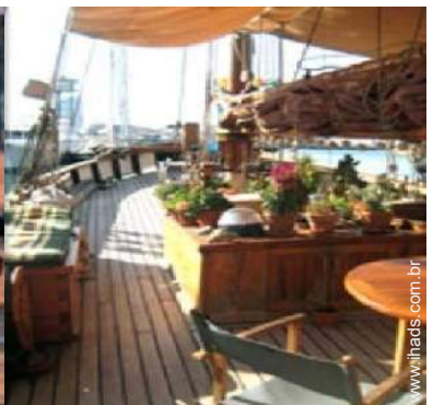
Ambiente exterior à disposição dos hóspedes