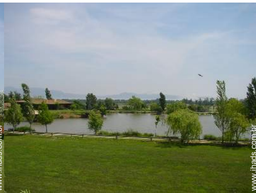
Casa de Encanto