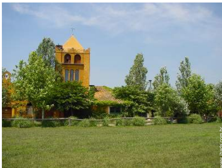
Casa de Encanto