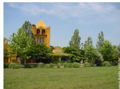
Casa de Encanto