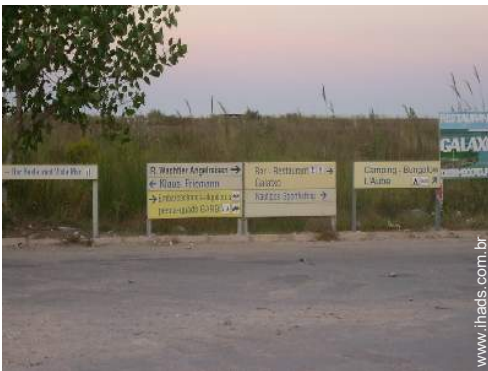
actividades náuticas nas proximidades