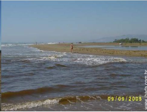
praia de naturismo