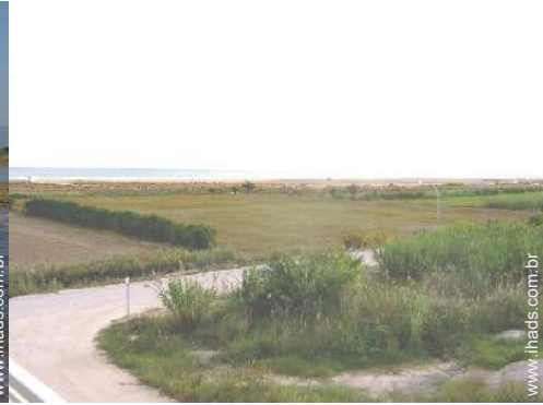
vista para campos agrícolas